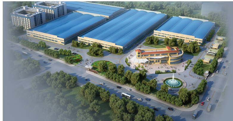
位于佛山高新区的生产基地